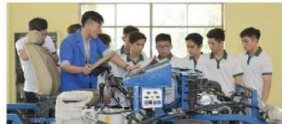
自動車整備訓練場