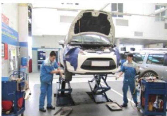
自動車エンジニア