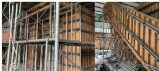
建設作業試験会場