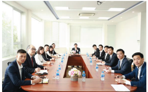
日本事業部の会議