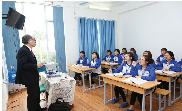
日本人講師による会話練習