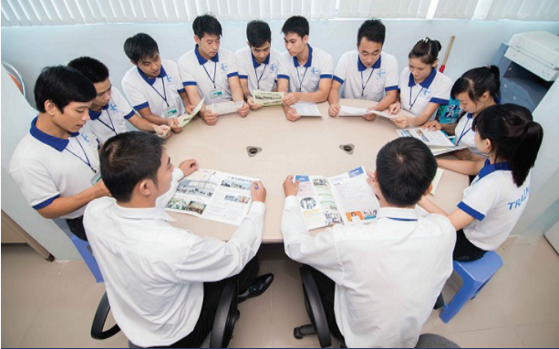
技能実習生制度の説明