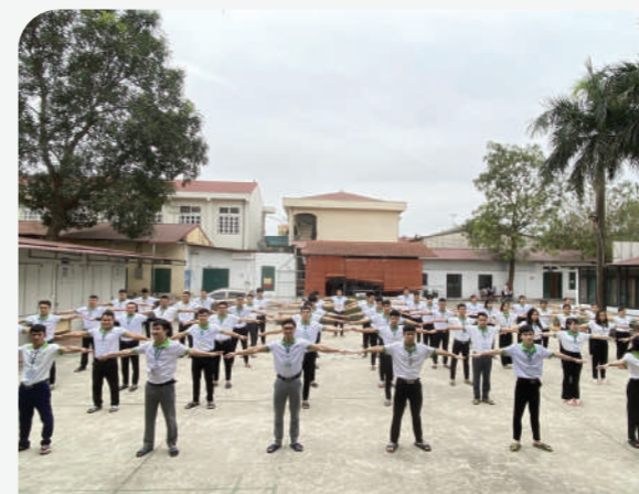
朝全員でラジオ体操