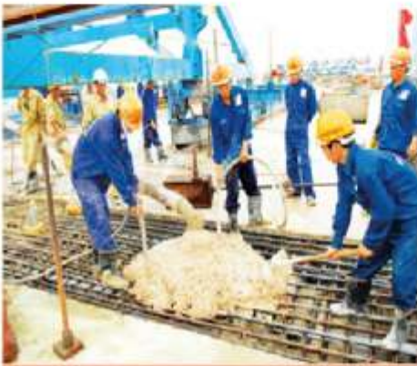
鉄筋施工, コンクリート