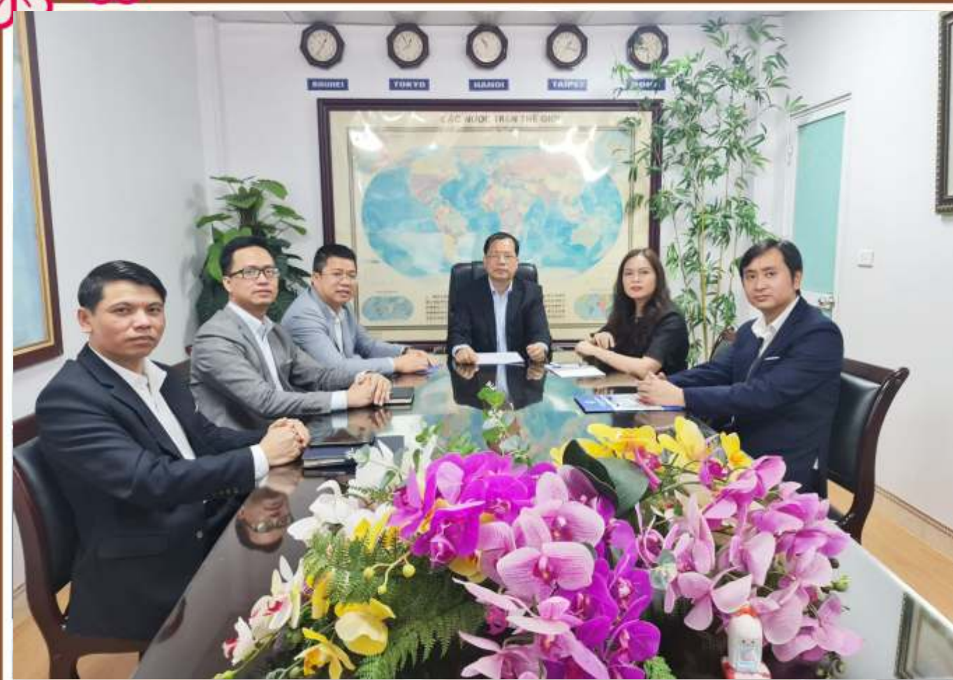
弊社会長 (写真中央)

タンロン人材管理と供給合資会社 ( THANG LONG JOV )は2021年2月にベトナム労働傷兵社会省に労働者を海外に派遣するための許可を与えられました。我が社の前身はタンロン国際協力投資株式会社( THANG LONG OSC)です。THANG LONG JOV会社の人材派遣許可と会社施設は THANG LONG OSC 会社から継承しました。現在、THANG LONG JOV会社は日本での実習生を1500名くらい、台湾、ヨーロッパ、中東などでだいたい4500名受け入れて管理しています。