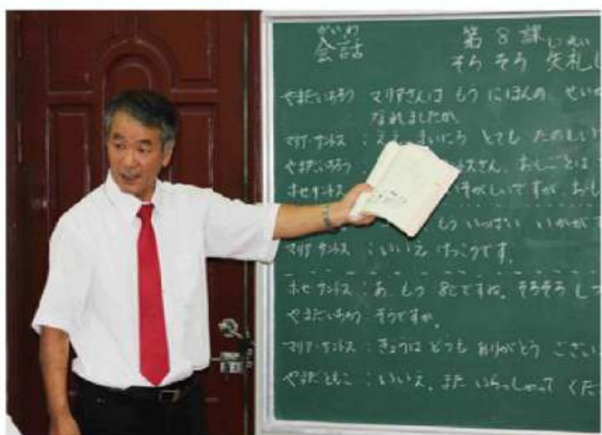
日本人教師による授業風景