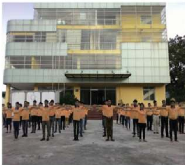
授業開始前の体操