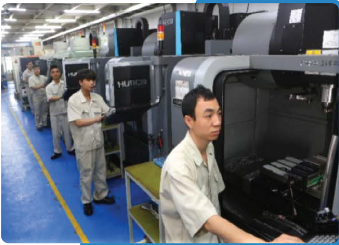
CNC機械オペレーター