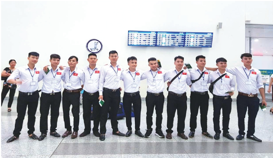
日本に旅立つ日、空港でのひとこま