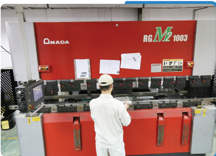
機械オペレーターの練習