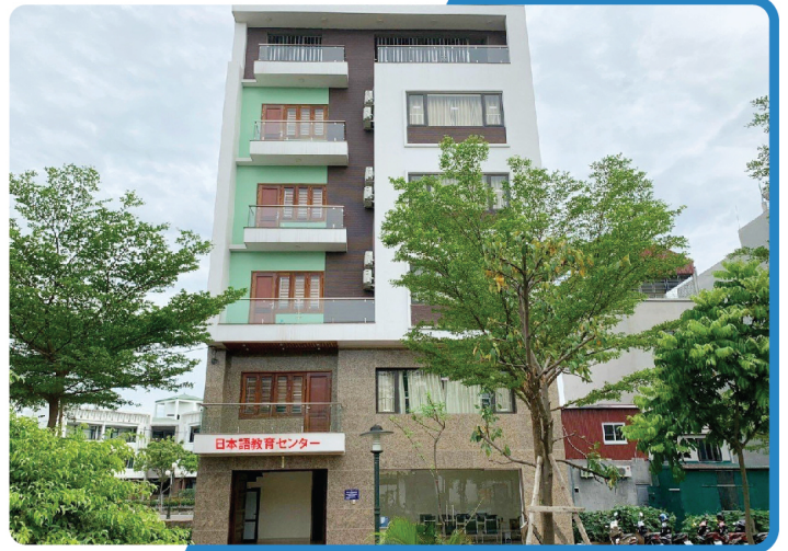
日本語教育センター